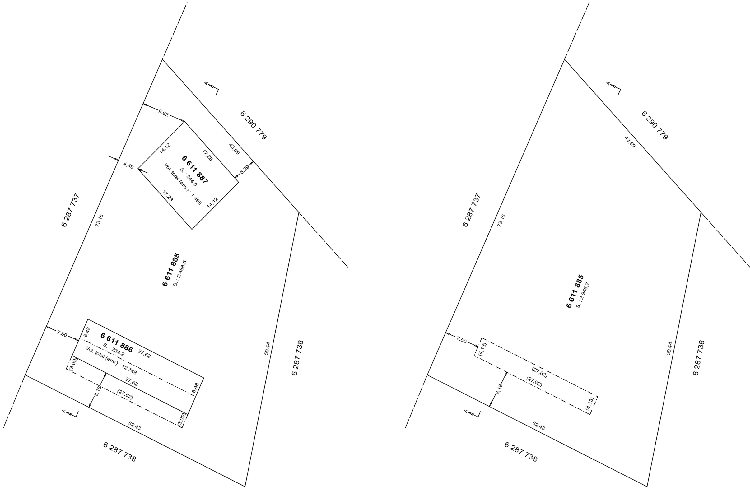
VUE EN PLAN DES LOTS 6 611 885 À 6 611 887 DE L'ALTITUDE 81,00 À L'ALTITUDE 85,00