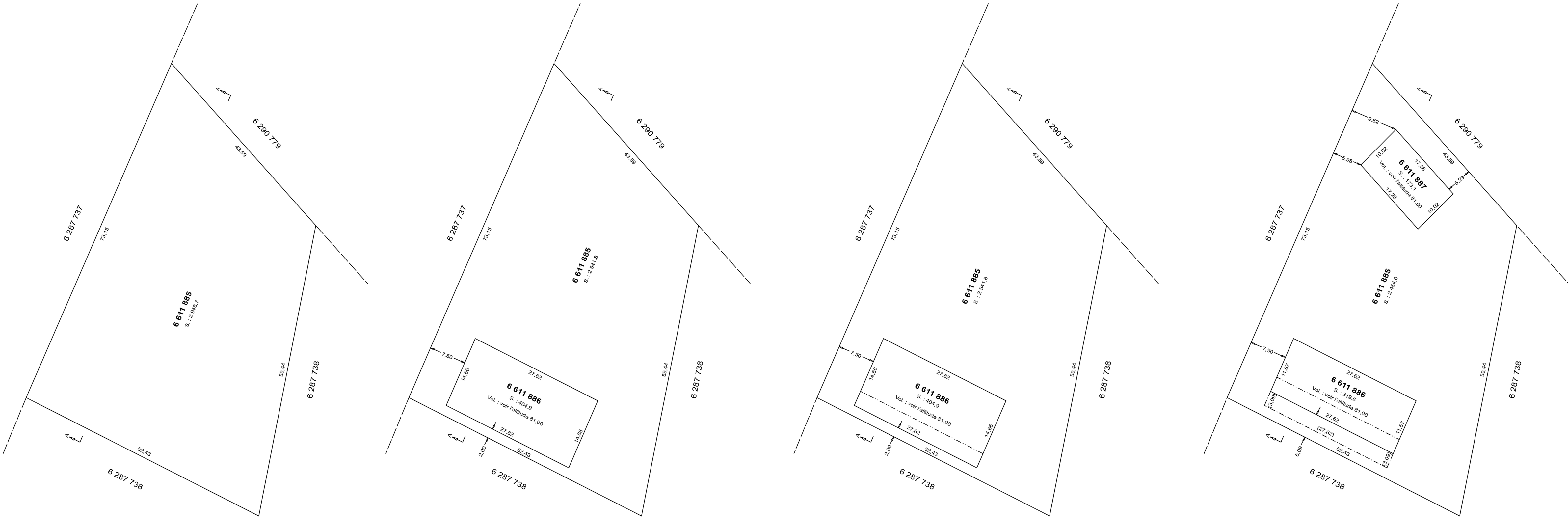
VUE EN PLAN DU LOT 6 611 885 DU NADIR À L'ALTITUDE 50,00